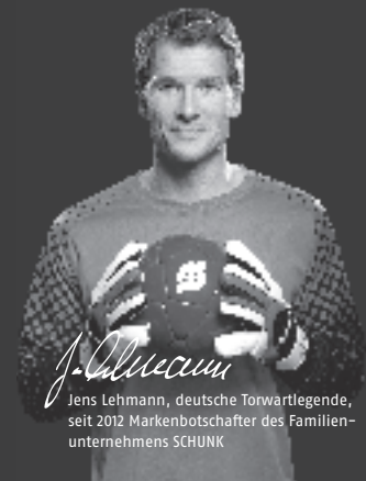
Jens Lehmann, deutsche Torwartlegende, seit 2012 Markenbotschafter des Familien- unternehmens SCHUNK